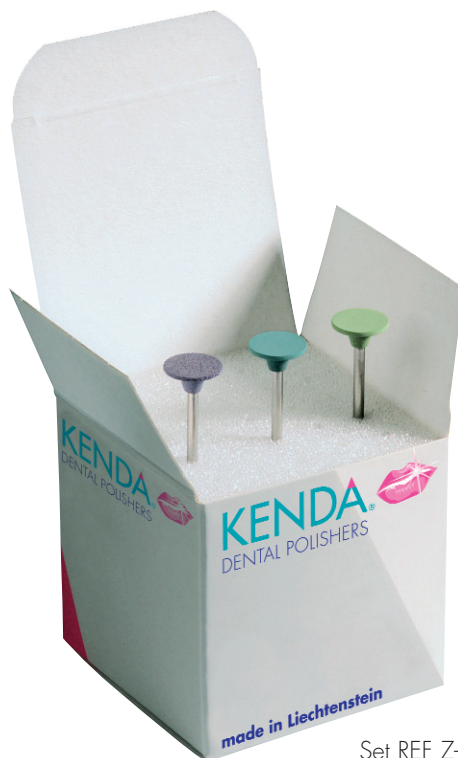
Set REF Z-014

Für beste Politurergebnisse auf Hochleistungskeramik, Zirkonoxid und Presskeramik